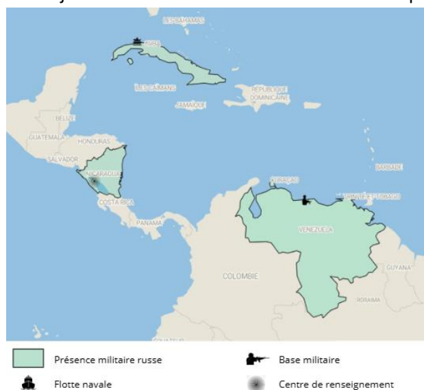
Figure 5 : Projection des forces armées russes en Amérique latine

Le maintien du soutien russe au Venezuela dans un contexte actuel particulièrement tendu suite aux blocus et accusations de la part des Etats-Unis n'apparaît cependant pas certain. Pourtant entériné par une dizaine d'accords de coopération militaires et commerciaux avec le président Maduro, ce soutien concerne à la fois des forces armées étatiques et privées, avec notamment un déploiement fin 2025 d'une centaine de personnels à Caracas.