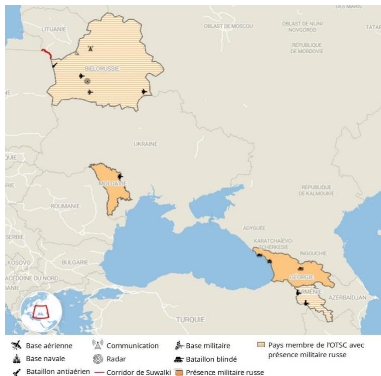
Figure 1 : Projection militaire russe en Europe et dans le Caucase

En Moldavie, la Transnistrie demeure un point de tension entre l'Occident et la Russie, et dont l'avenir conditionne la trajectoire européenne moldave d'ici 2030 . En Biélorussie, le conflit ukrainien accélère l'interopérabilité entre les forces russo-biélorusses avec l'implantation de deux nouvelles bases aériennes, l'organisation de plusieurs exercices conjoints simulant une occupation du corridor de Suwałki , et le déploiement annoncé de missiles Oreshnik . Ces missiles seraient de portée intermédiaire et viseraient à compenser les vulnérabilités face aux défenses antimissiles occidentales.