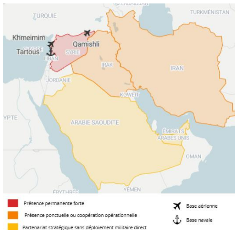
Figure 4 : Etat de la présence russe au Moyen-Orient