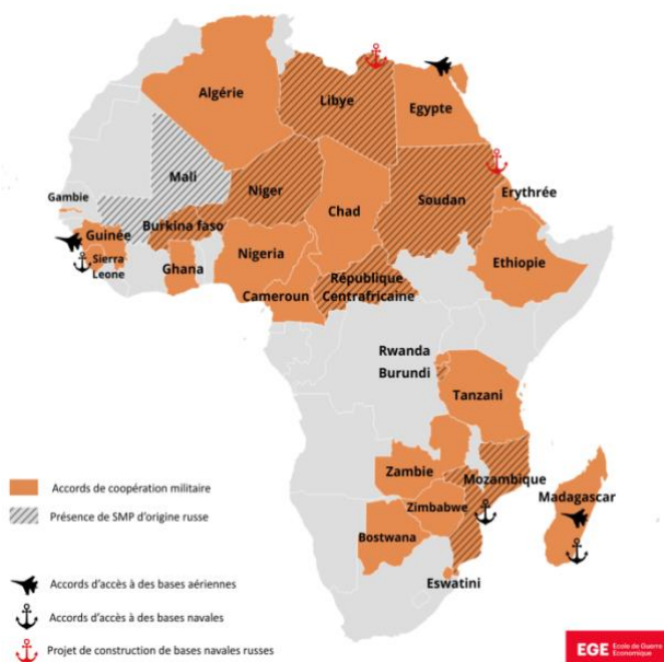
Figure 2 : Etat de la présence militaire russe en Afrique

minérales tels que des diamants ou de l'or voire des exploitations forestières en Centrafrique comme en février 2021.